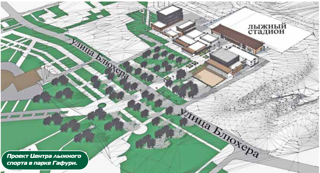
Проект Центра лыжного спорта в парке Гафури.