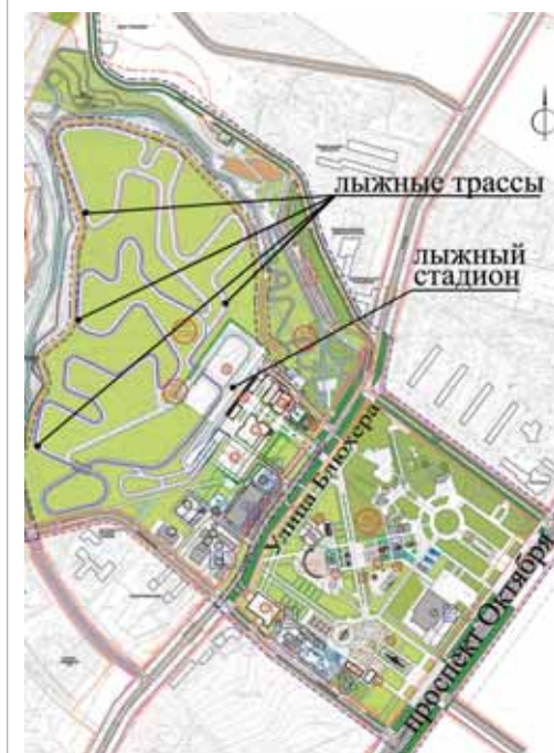
Схема реконструкции парка Гафури и прокладки лыжных трасс в парковой зоне за улицей Блюхера.

- На сегодняшний день площадь парка составляет 29 гектаров: 9 - выше и 20 гектаров - ниже улицы Блюхера, - говорит директор парка Гафури Сергей Некрасов. - Заросшая лесом нижняя часть парковой территории за 50 последних лет никем не вырубалась и не вычищалась. В результате 60 процентов растущих у нас деревьев старые или больные - при санитарных рубках выясняется, что большинство стволов сгнили изнутри и, образно выражаясь, держатся «на коре». После благоустройства и прокладки трасс эту обширную зеленую зону, расположенную в географическом центре Уфы, можно использовать для полноценного отдыха горожан. В зимнее время на снежных трассах будут заниматься любители беговых лыж. А летом здесь можно кататься на велосипедах, скейтбордах, роликовых коньках или просто гулять на свежем воздухе.