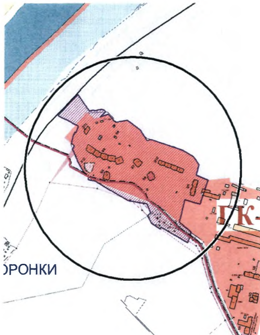
Схема градостроительного регулирования