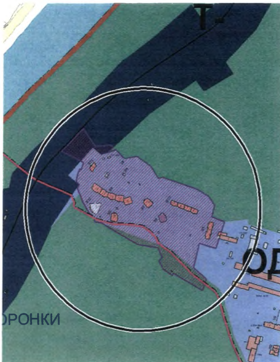
Схема градостроительного зонирования