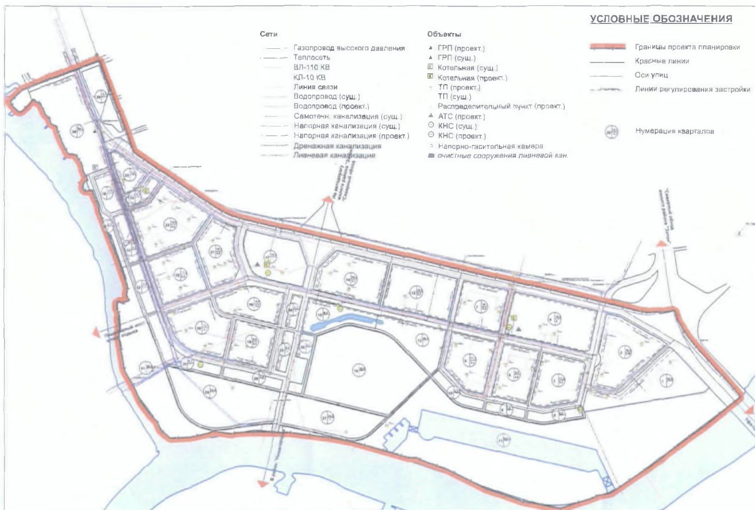
Чертеж планировки территории с отображением красных линий и объектов инженерной инфраструктуры

Управляющий Делами Администрации городского округа город Уфа Республики Башкортостан