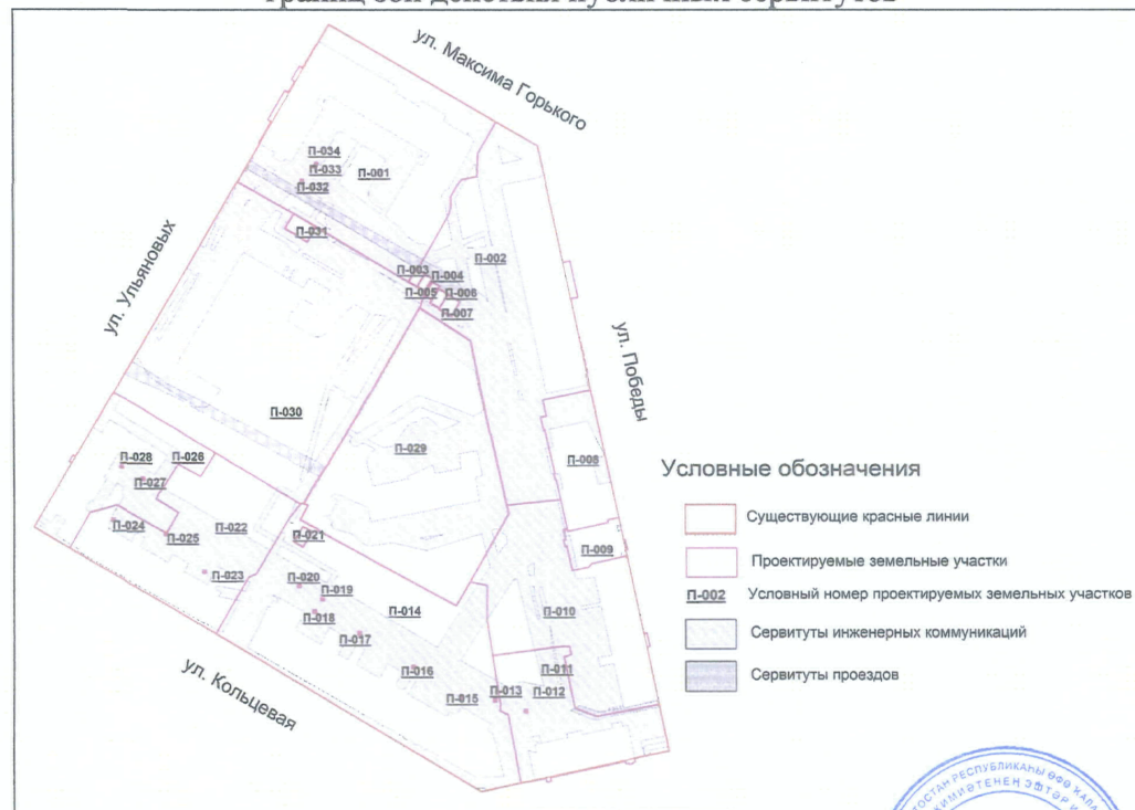
Чертеж межевания территории с отображением красных линий, линий регулирования застройки, границ зон действия публичных сервитутов

Управляющий Делами Администрации городского округа город Уфа Республики Башкортостан