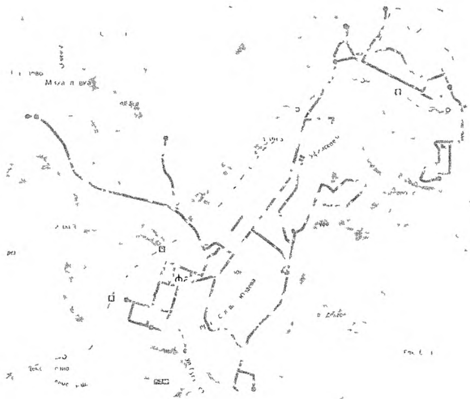
Рис. 3 - Схема троллейбусной маршрутной сети

Протяженность троллейбусной контактной сети г.Уфы составляет 230,7 км. Перевозка троллейбусами за 2017 г. составила 8,3 млн. пассажиро-поездов. Схема троллейбусной маршрутной сети представлена на рисунке 3: