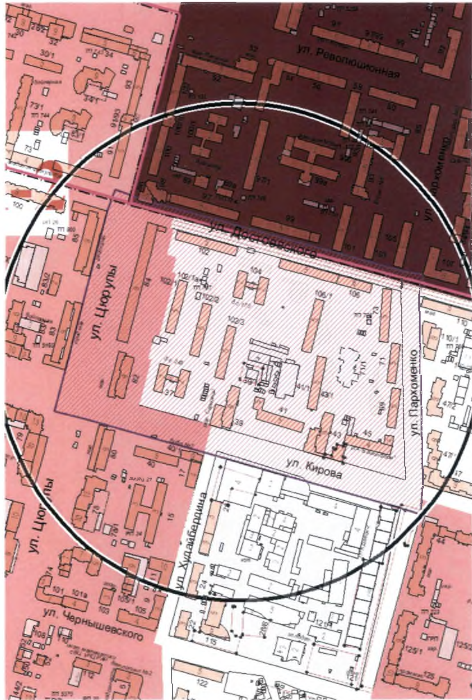
Схема градостроительного регулирования