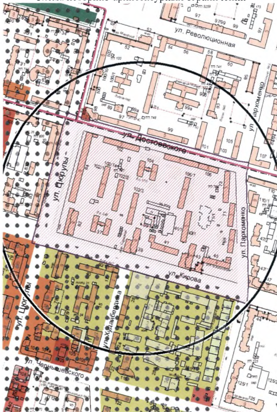
Схема историко-архитектурных ограничений