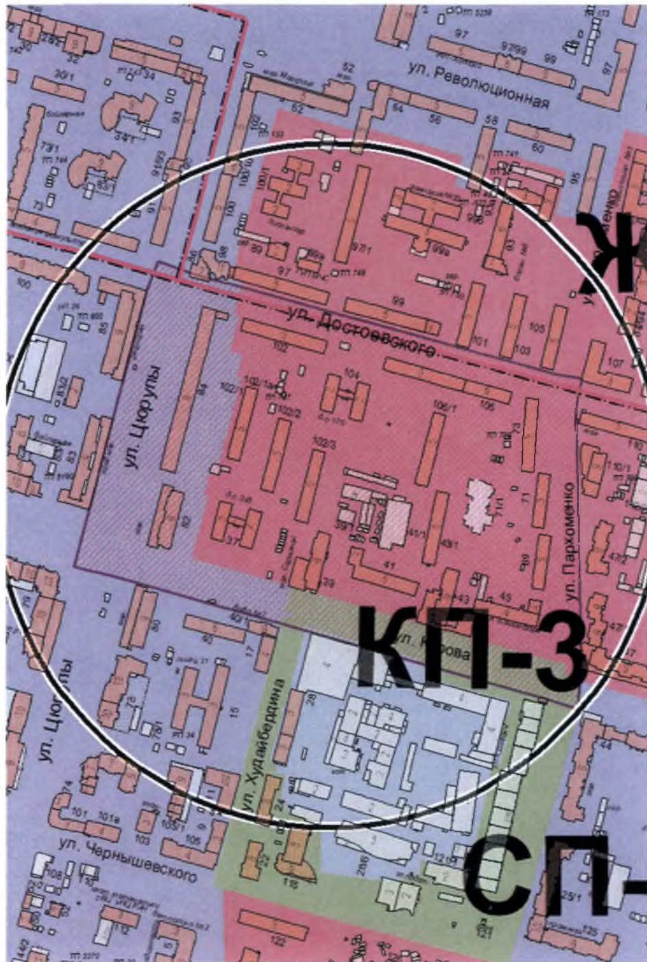
УСЛОВНЫЕ ОБОЗНАЧЕНИЯ к схеме градостроительного зонирования