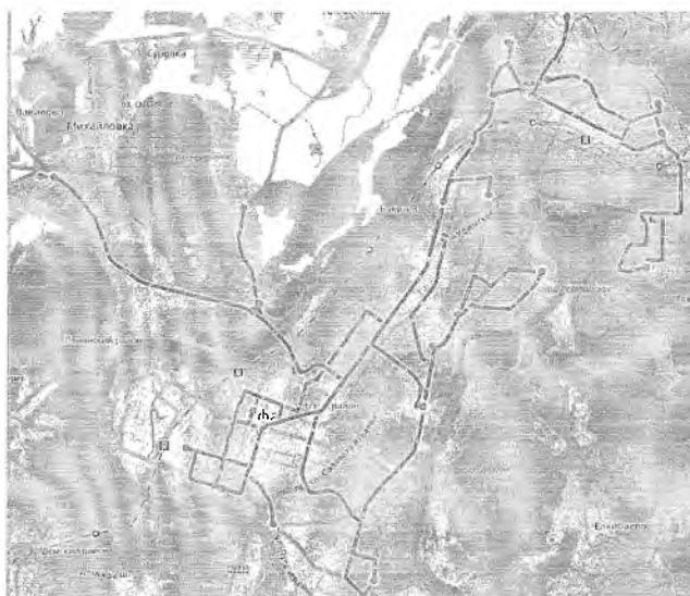
Рис. 3 - Схема троллейбусной маршрутной сети

Протяженность троллейбусной контактной сети г.Уфы составляет 225,9 км. Перевозка троллейбусами за 2019 г. составила 9,4 млн. пассажиро-поездки. Схема троллейбусной маршрутной сети представлена на рисунке 3: