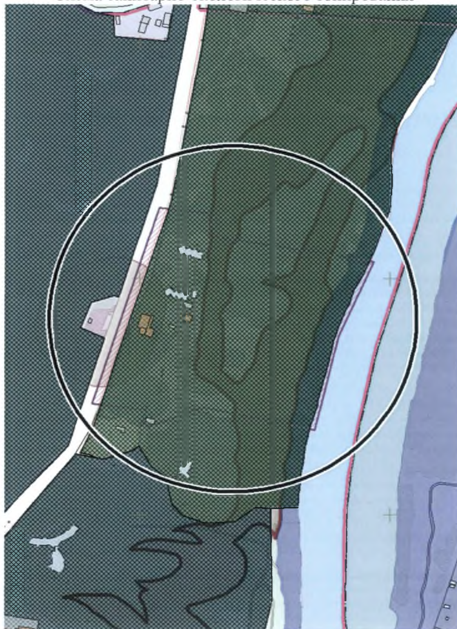
Схема санитарно-экологического зонирования