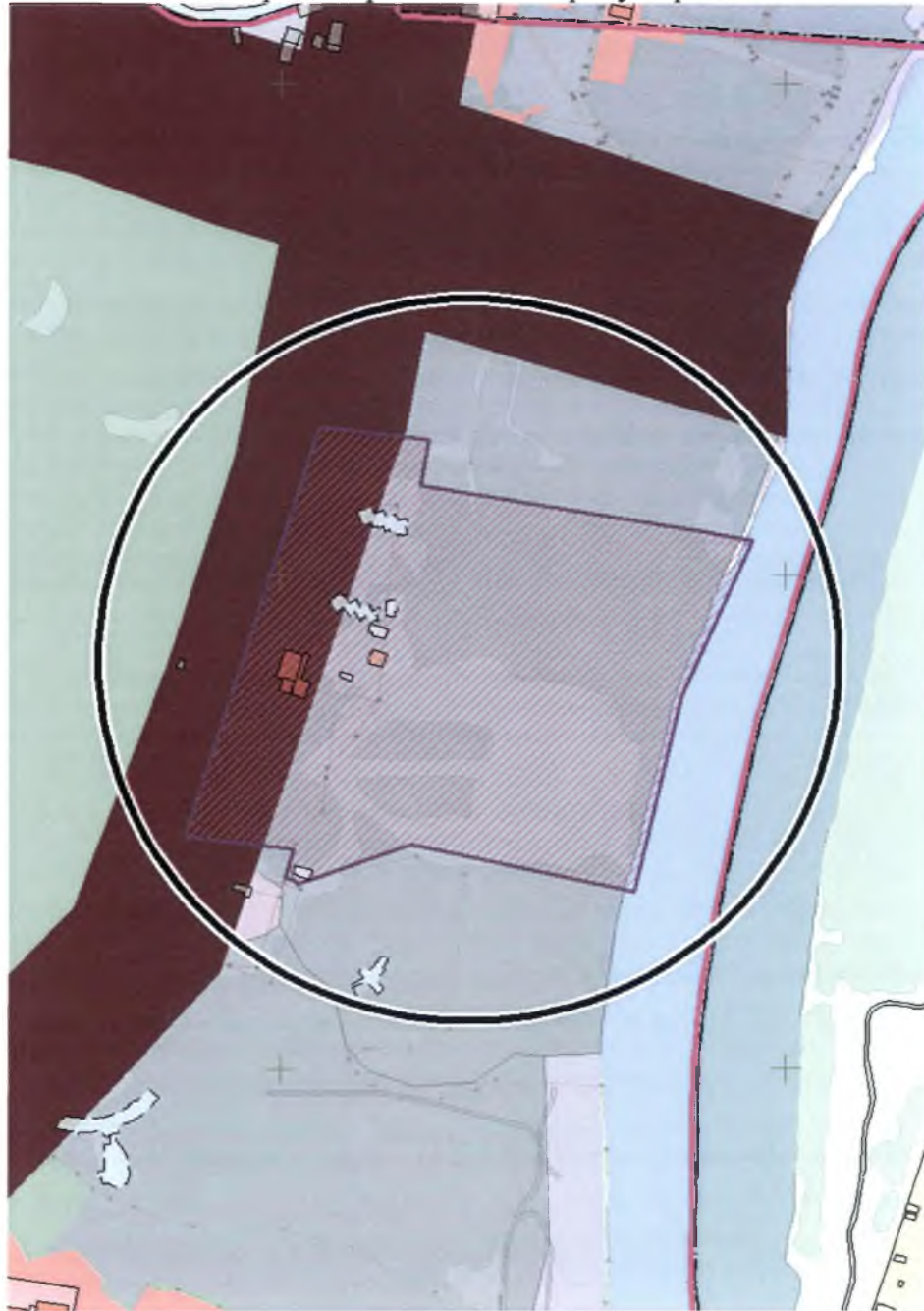
Схема градостроительного регулирования