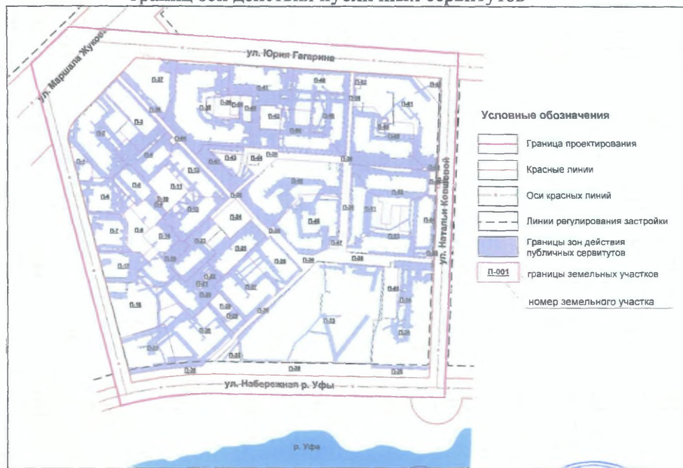
Чертеж межевания территории с отображением красных линий, линий регулирования застройки, границ зон действия публичных сервитутов

Управляющий Делами Администрации городского округа город Уфа Республики Башкортостан